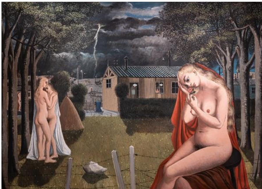
Paul Delvaux, The Storm , 1962 @ De Jonckheere